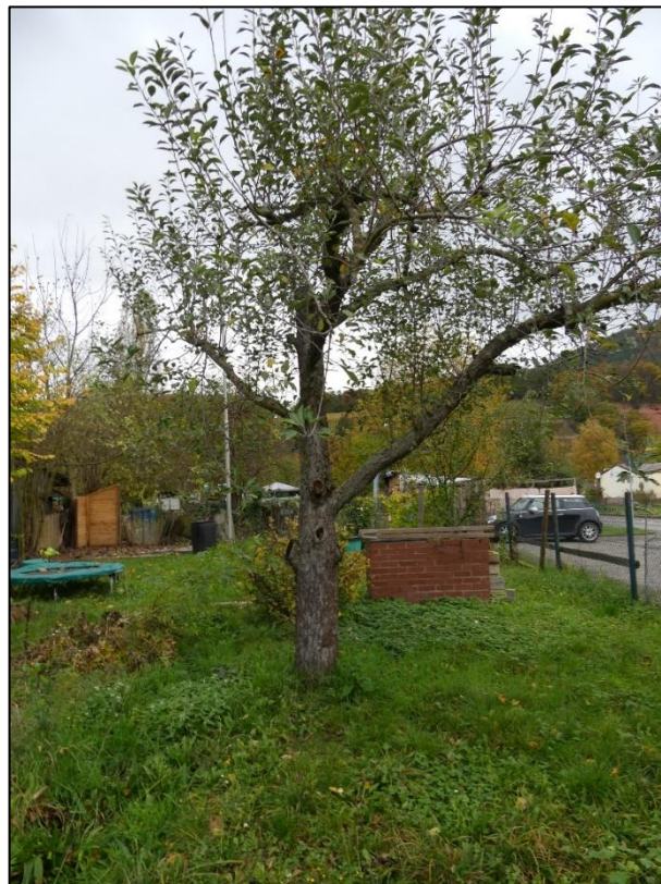
Abb. 8 Gartenbrache im zentralen westlichen Teil des alten Geltungsbereichs (06.11.2019)