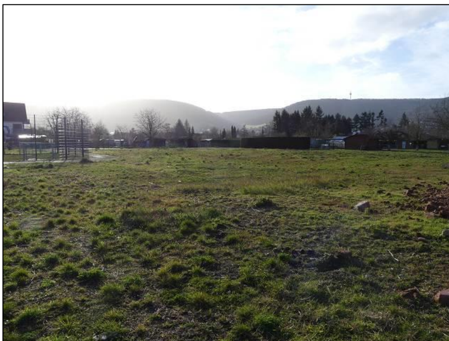
Abb. 15: Östlicher Teil des Geltungsbereiches (Flurstücke 900/5, 900/6, 900/8-12) nach Beseitigung der Gärten (Abb. 4-12) (22.02.2022)