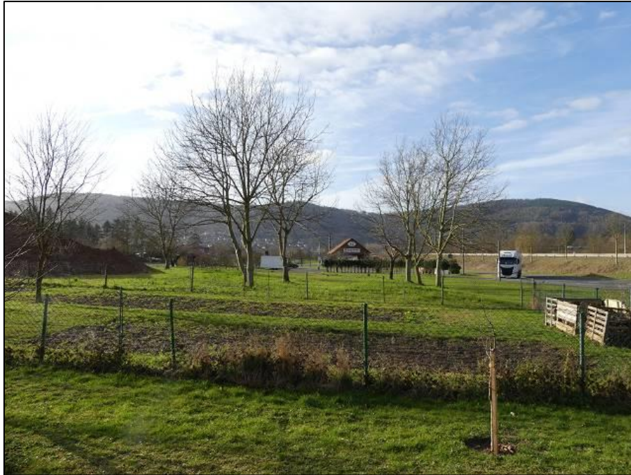
Abb. 14: Westlicher Teil des Geltungsbereiches (Flurstücke 9004/4 und 900/6), Blick Richtung Süden (22.02.2022)