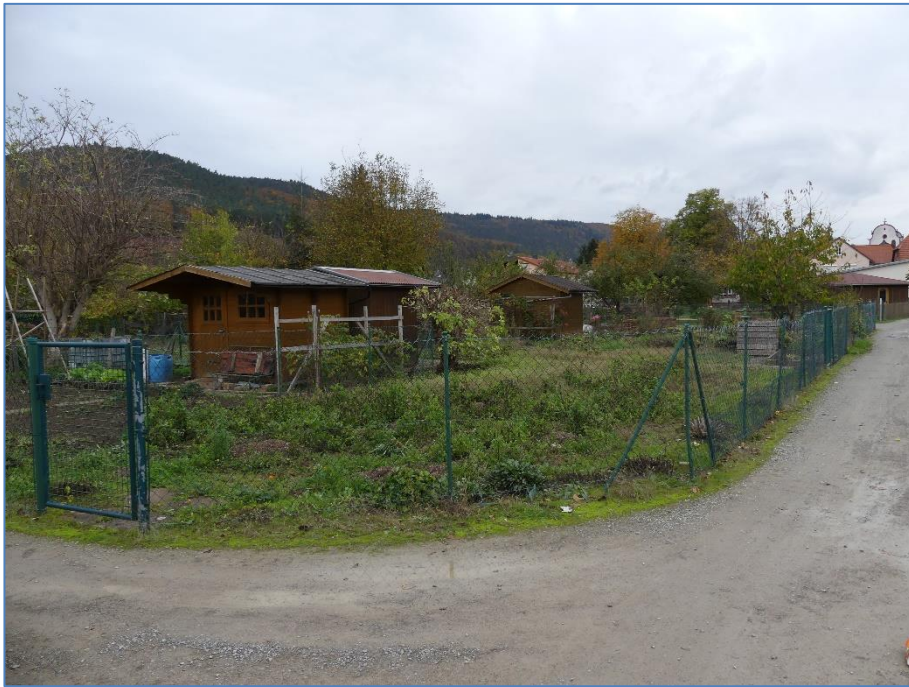
Abb. 5: Ostgrenze des alten Geltungsbereiches, Blick Richtung Norden (06.11.2019)