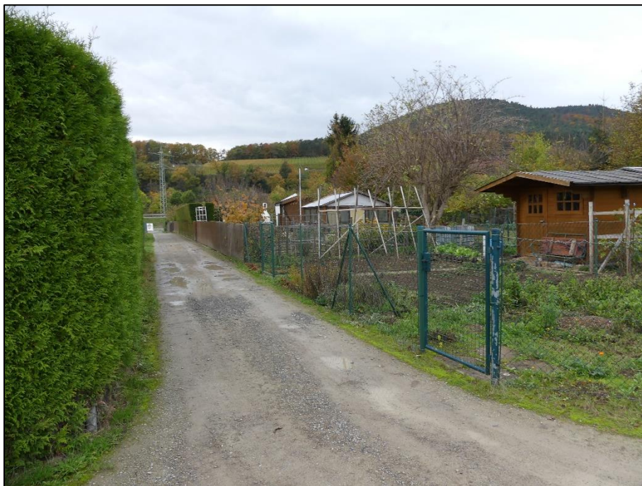
Abb. 6 Südgrenze des alten Geltungsbereiches, Blick nach Westen (06.11.2019)