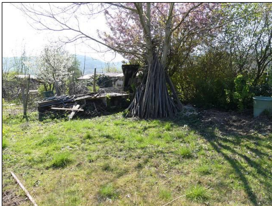
Abb. 10: Gartenbrache im südlichen Teil des alten Geltungsbereichs mit für Zauneidechsen geeigneten Strukturen (16.04.2020)