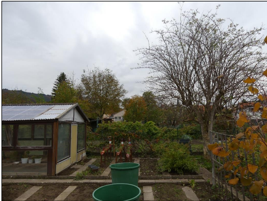
Abb. 7 Intensiv genutzter, strukturarmer Garten im Süden des alten Geltungsbereichs (06.11.2019)