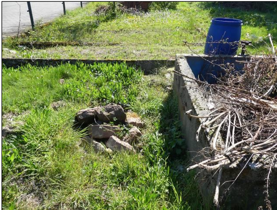
Abb. 9: Gartenbrache im südlichen Teil des alten Geltungsbereichs mit für Zauneidechsen geeigneten Strukturen (16.04.2020)