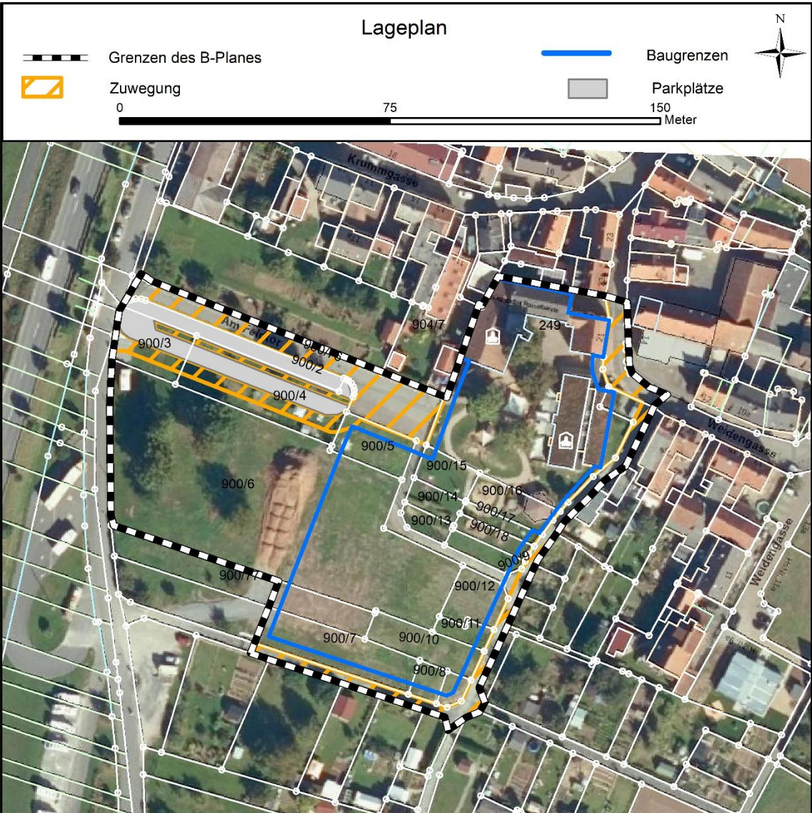
Abb. 2: Übersichtslageplan über Luftbild