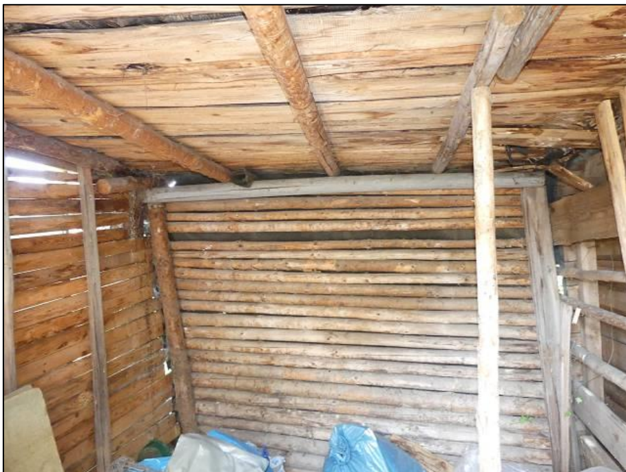
Abb. 11: Gartenhütte im südlichen Teil des alten Geltungsbereichs, potenzielle Quartierstandorte für Fledermäuse und potenzielle Niststandorte für Vögel (15.09.2020)