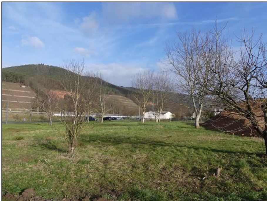
Abb. 13: Westlicher Teil des Geltungsbereiches (Flurstück 900/6), Blick Richtung Norden (22.02.2022)