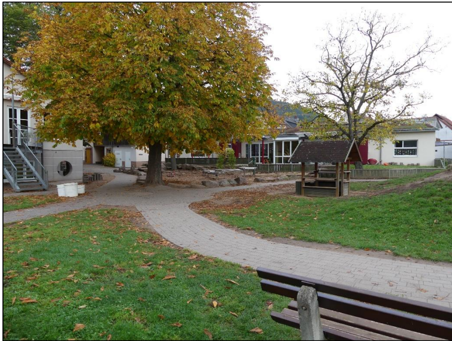
Abb. 3 Bestehende Kindertagesstätte im Nordosten des alten Geltungsbereichs (06.11.2019)