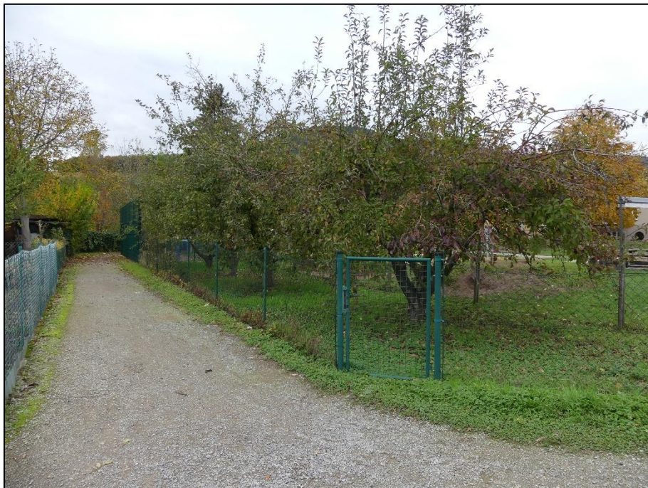
Abb. 4 Kleine Obstplantage im Zentrum des alten Geltungsbereichs (06.11.2019)