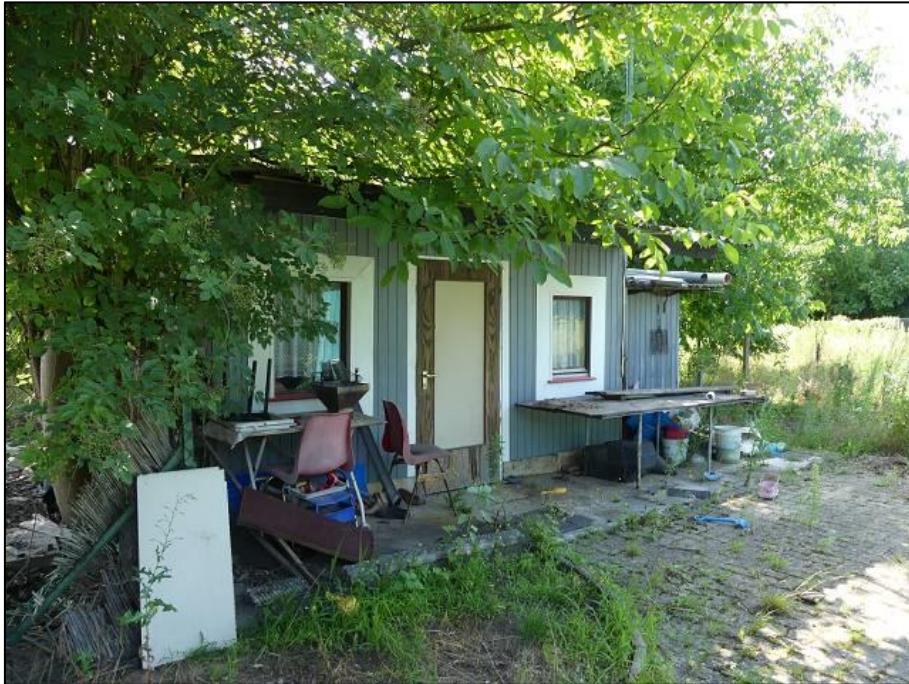
Abb. 11: Gartenhütte im südlichen Teil des alten Geltungsbereichs, potenzielle Quartierstandorte für Fledermäuse und potenzielle Niststandorte für Vögel (21.07.2020)