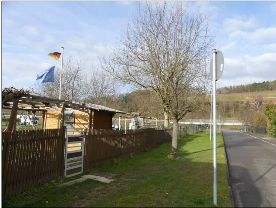
Abb. 12: Noch genutztes Gartengrundstück auf Flurstück 900/4, Blick Richtung Westen (22.02.2022)